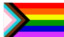
Drapeau arc-en-ciel avec couleurs trans et personnes racisées